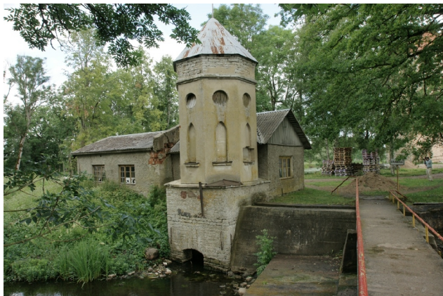
27 Koluvere N:58-54-18 E:24-06-10