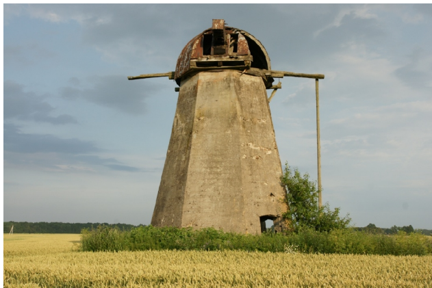
43 Pasvalys, Čižiškiai N:56-01-58 E:24-23-44