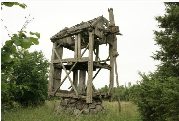
07 Raugu N:58-36-15 E:22-48-26