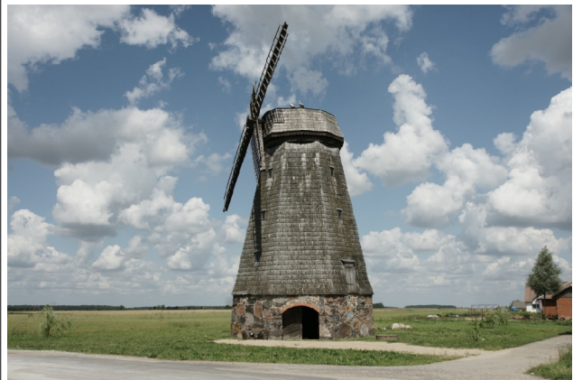
60 Stačiūnai N:55-56-21 E:23-37-44