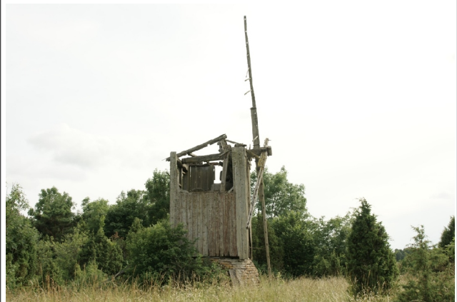
04 Liigalaskma2 N:58-34-40 E:23-00-05