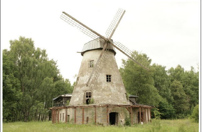
22 Somera N:58-18-44 E:22-14-51