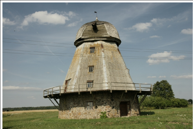
70 Rude(s) N:56-23-19 E:21-05-45