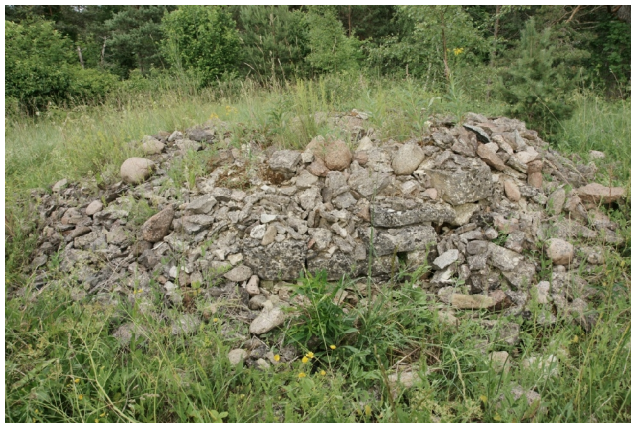
21 Viki N:58-20-54 E:22-05-01