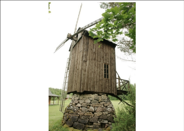
08 Riidama N:58-36-20 E:22-47-42