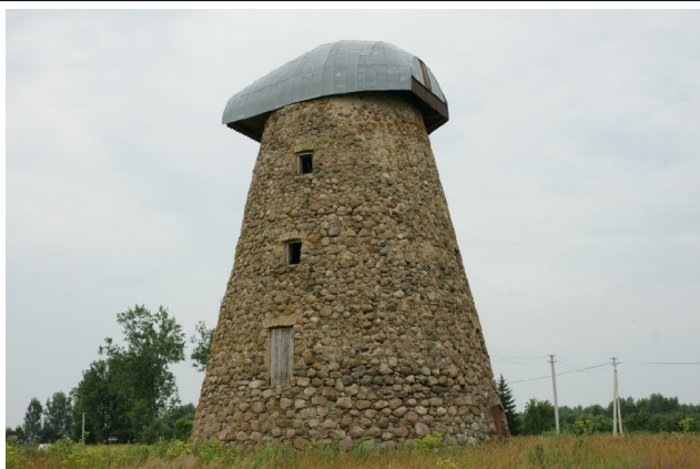
45 Katinai N:55-35-06 E:24-24-23