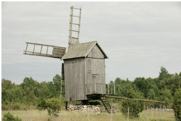
19 Kõruse5 N:58-27-04 E:21-58-16