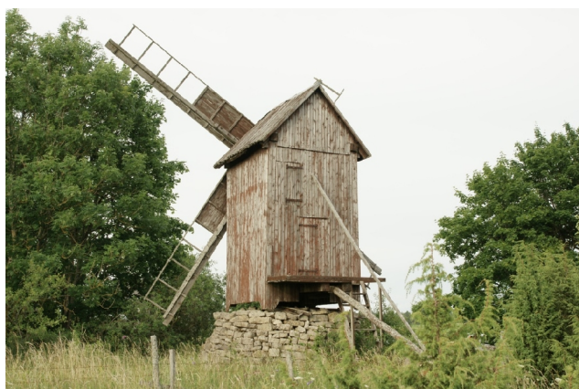
09 Õeste N:58-32-21 E:22-43-53