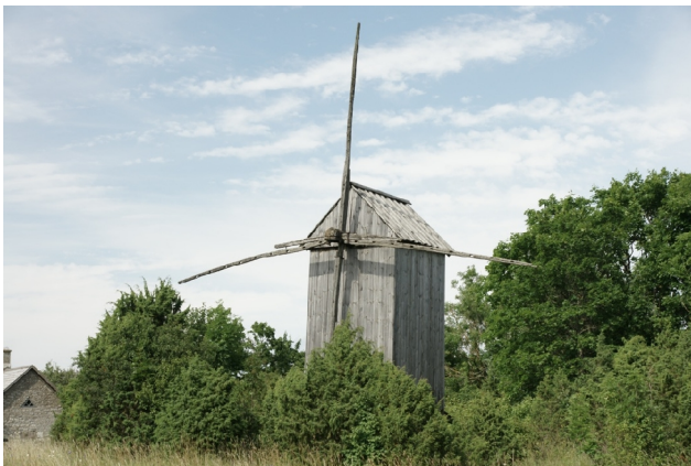
03 Liigalaskma1 N:58-34-42 E:23-00-22