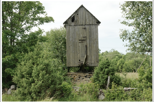
18 Kõruse4 N:58-26-52 E:21-56-59