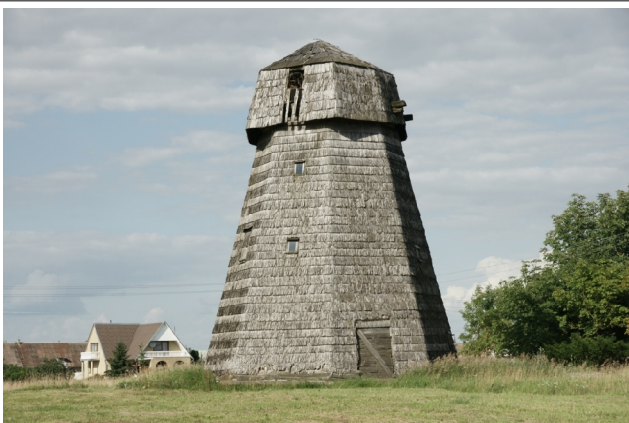
63 Alksnupiai N:55-49-11 E:23-46-30