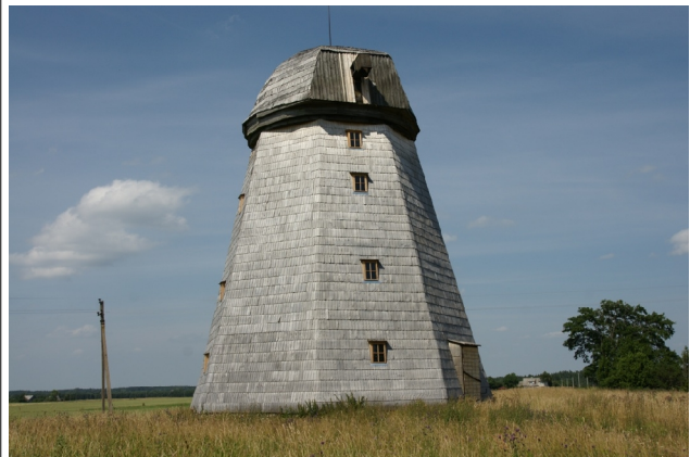
68 Lazdininkai N:56-00-22 E:21-13-01