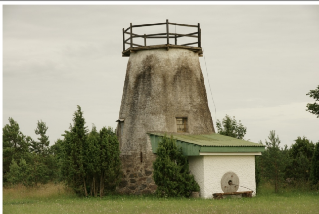
23 Vennati N:58-17-03 E:22-18-13