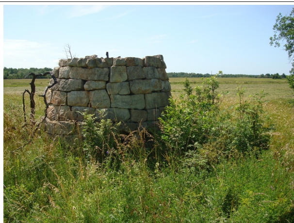
14 Läägi N:58-24-18 E:22-01-32