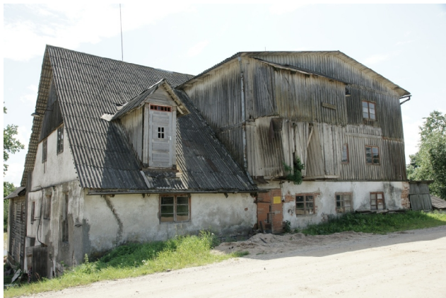
35 Sangaste N:57-54-52 E:26-19-28