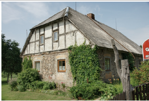
65 Babrungėnai N:55-59-57 E:21-51-49