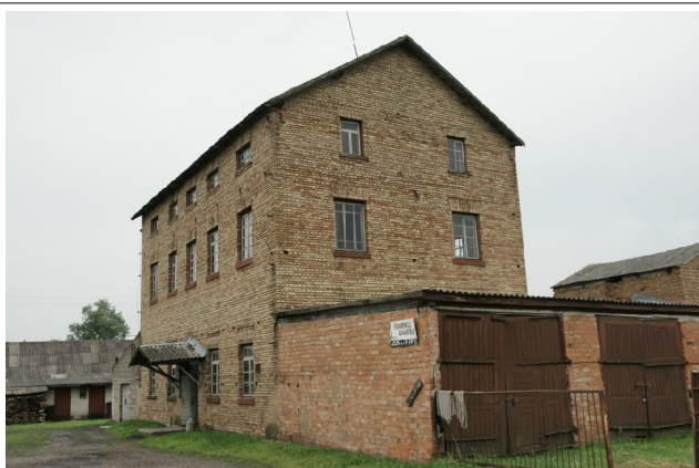
47 Ramygala N:55-30-14 E:24-18-10