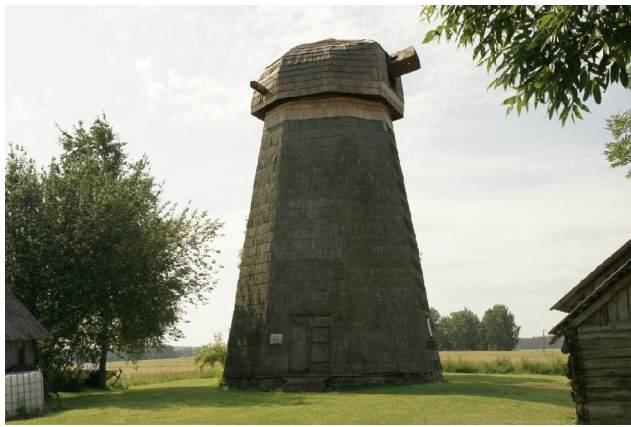
33 Tamme N:58-16-23 E:26-08-23