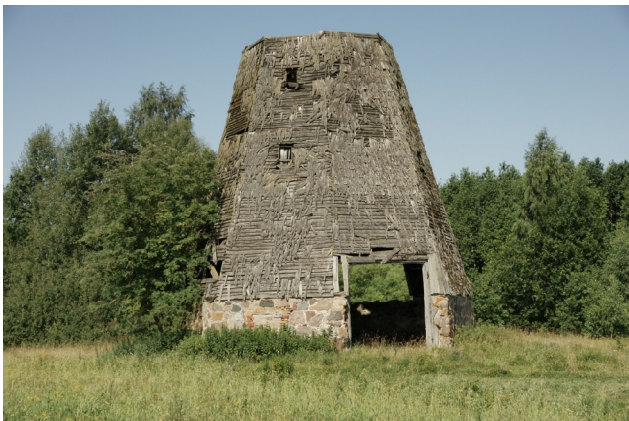
59 Triškoniai (Gegiedziai) N:56-07-25 E:23-52-10