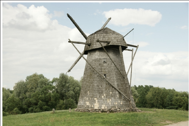
62 Pakalniškiai N:55-46-11 E:23-50-58