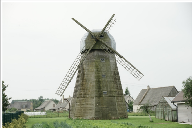
46 Vadokliai N:55-29-39 E:24-28-55