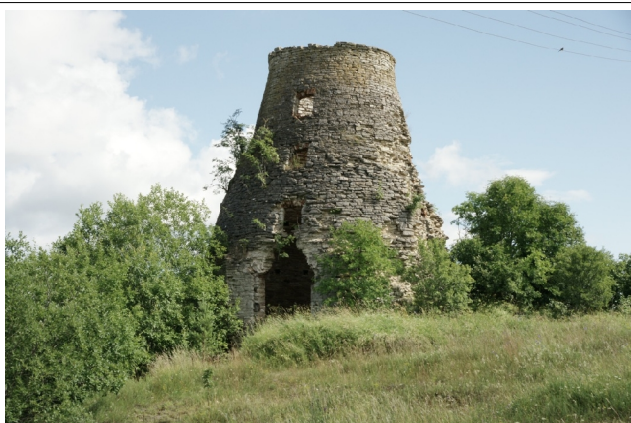
29 Laisilla N:58-54-25 E:24-07-49