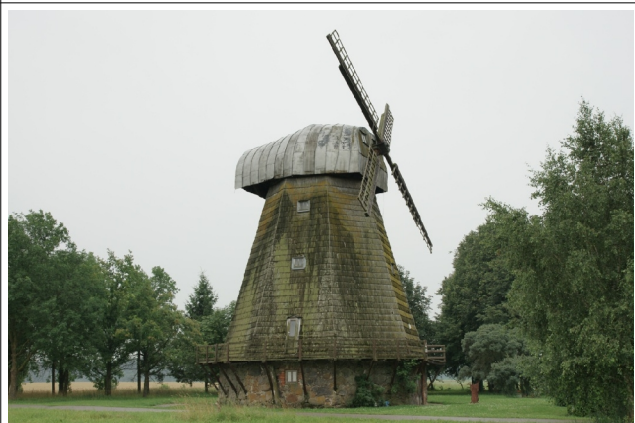
48 Stultiškiai N:55-37-46 E:24-13-53