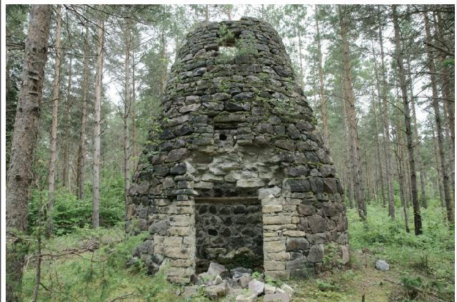
06 Haapsu N:58-36-40 E:22-56-13