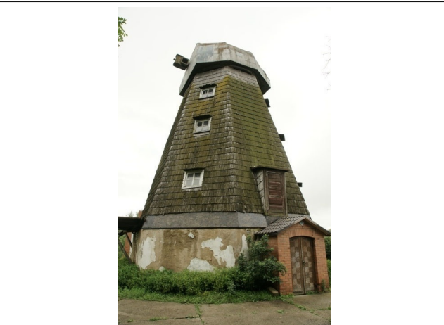
53 Udekai N:56-09-07 E:24-01-03