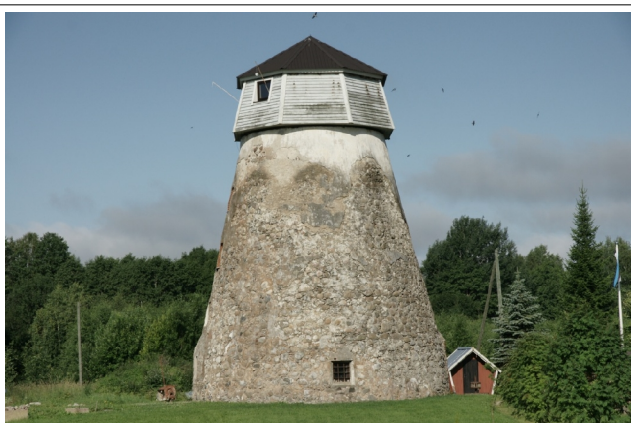
31 Oiu Link-about N:? E:?