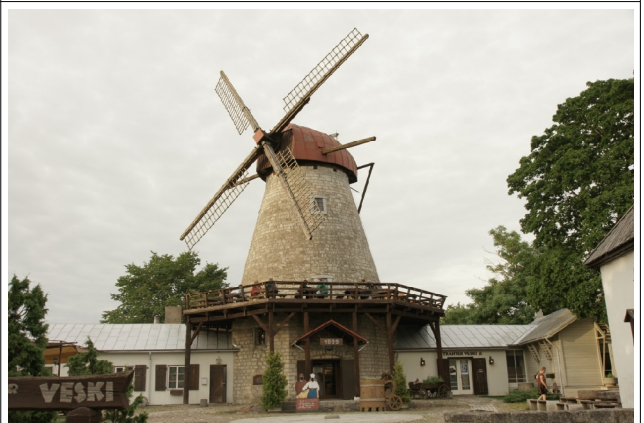
24 Kuressaare N:58-15-06 E:22-29-24