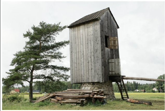
26 Ellemaa N:59-03-29 E:24-11-39