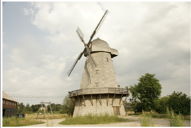
42 Ceraukste (Ribbes) N:56-21-35 E:24-17-02