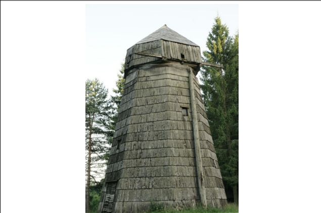
64 Telšiai N:55-57-50 E:22-14-32