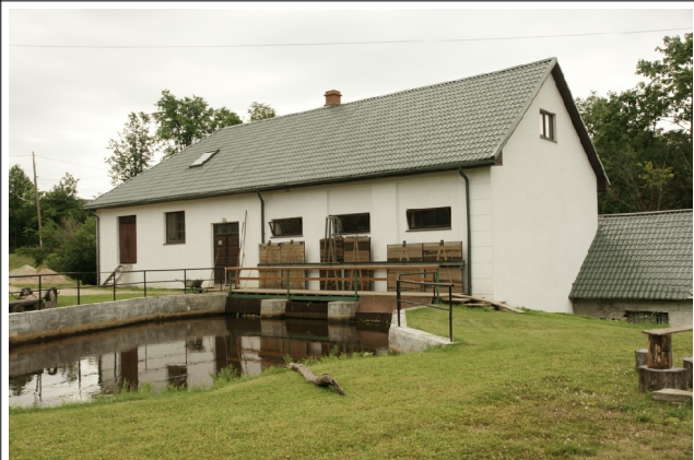
40 Ergli N:56-53-56 E:25-38-27