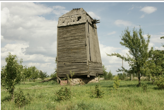
61 Voskoniai N:55-52-39 E:23-33-49