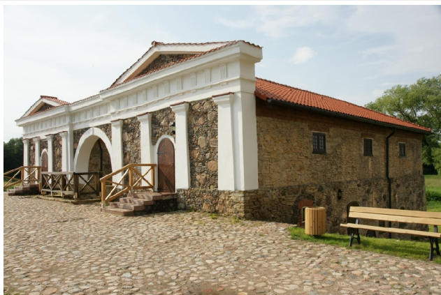
51 Pakruojo3 N:55-59-27 E:23-52-51