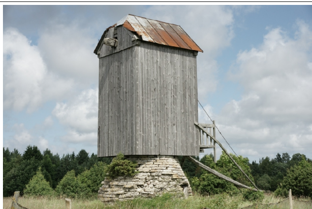
13 Leedri N:58-16-54 E:22-00-33