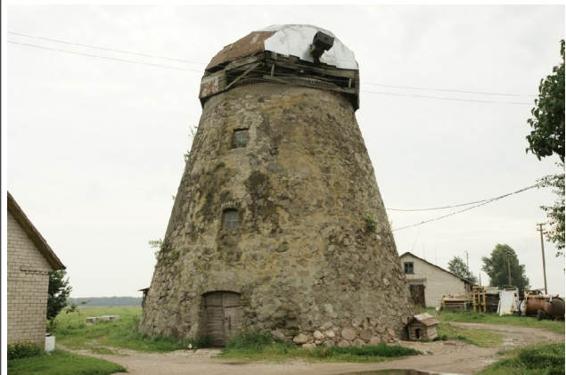
44 Kbeliai N:55-37-52 E:24-26-01