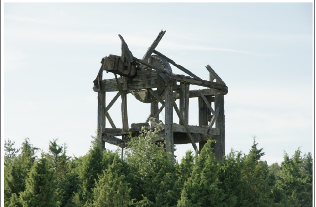
20 Kõruse6 N:58-27-33 E:21-57-57