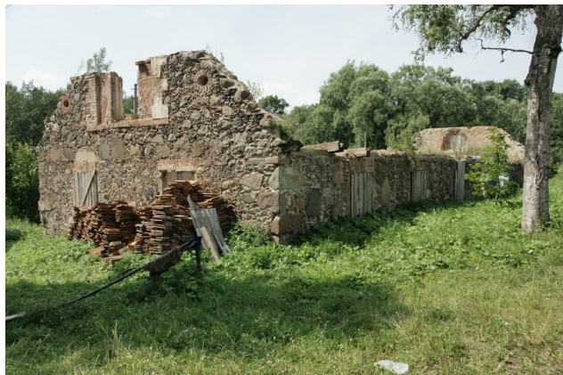
67 Darbėnai N:56-01-07 E:21-14-33