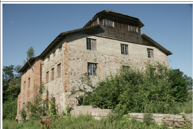
32 Rõika N:58-29-14 E:26-03-08