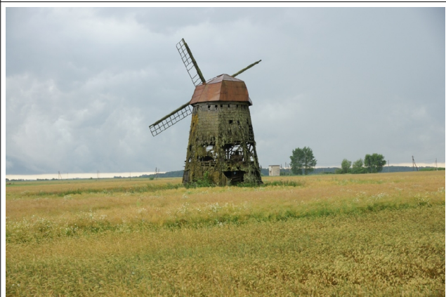
54 Steigviliai N:56-11-49 E:24-00-20