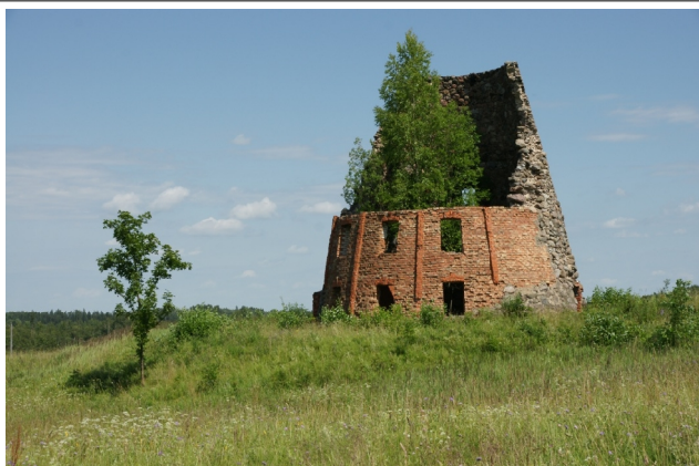
39 Laktas N:56-55-38 E:25-55-27