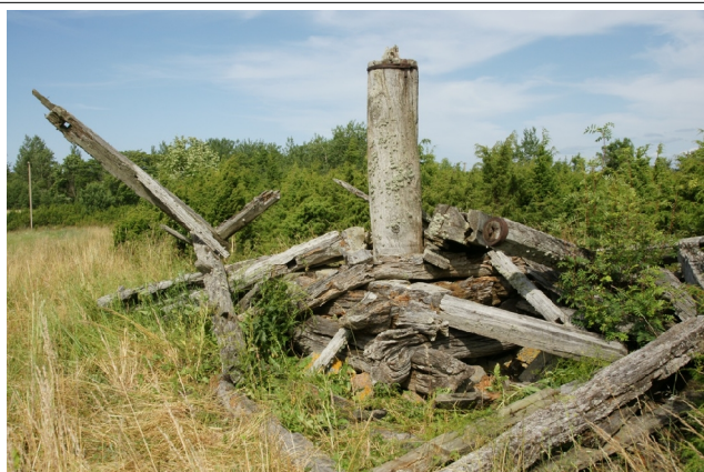
15 kõruse1 N:58-26-42 E:21-58-40