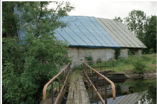
28 Kullamaa N:58-53-07 E:24-05-32