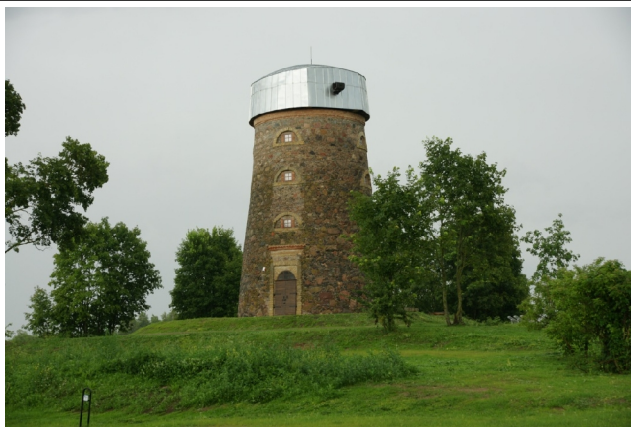
49 Pakruojo1 N:55-59-27 E:23-52-51