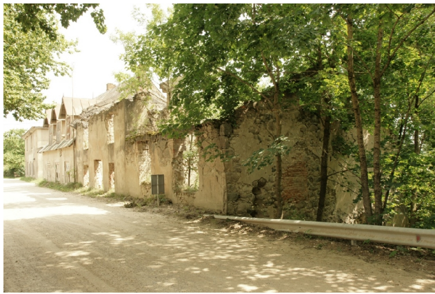
41 Siljāņi (Recijas) N:56-44-18 E:25-34-41