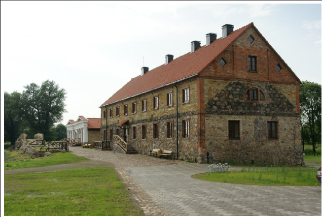
50 Pakruojo2 N:55-59-27 E:23-52-51