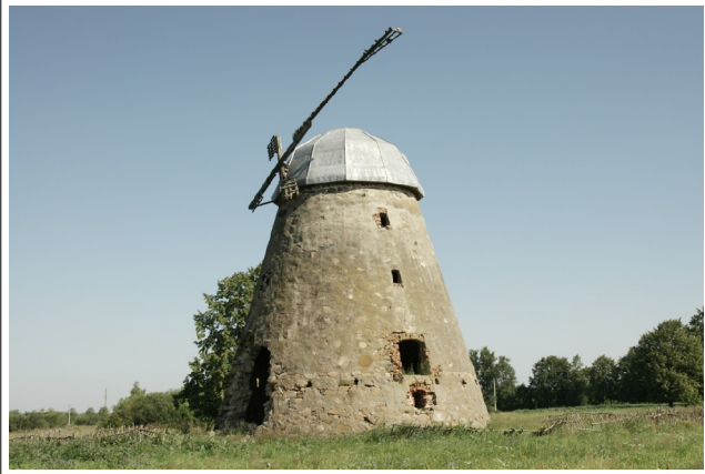
58 Pašvitinys N:56-09-45 E:23-49-12