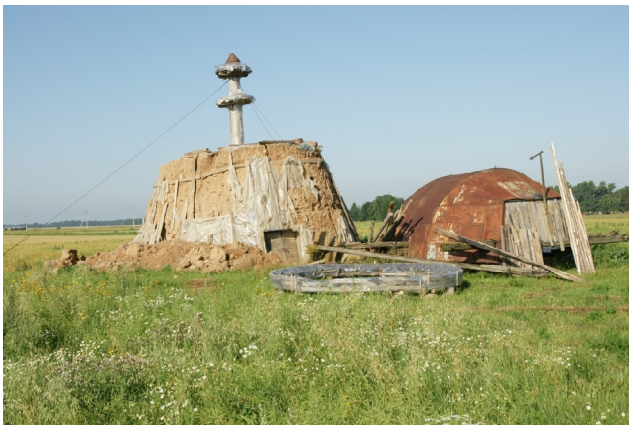
57 Melniai N:56-14-34 E:23-43-36