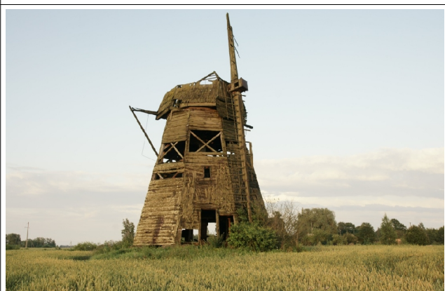
56 Gelčiai N:56-13-24 E:23-57-50