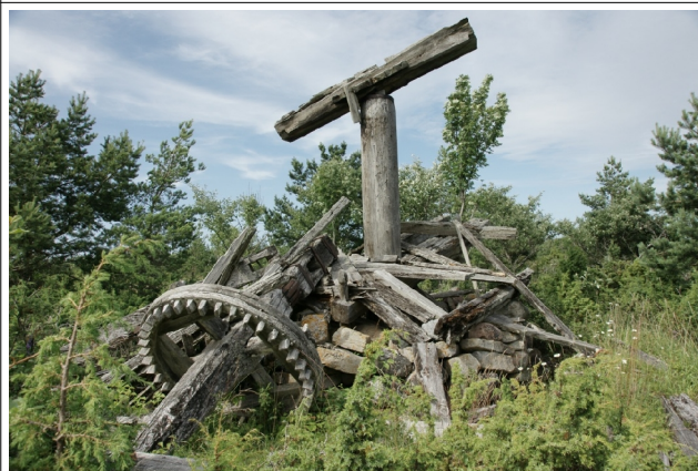
16 kõruse2 N:58-26-32 E:21-57-31