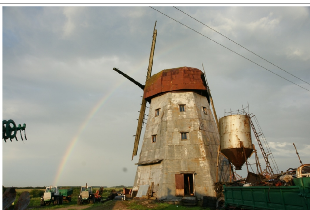
55 Diržiai N:56-13-12 E:24-00-20