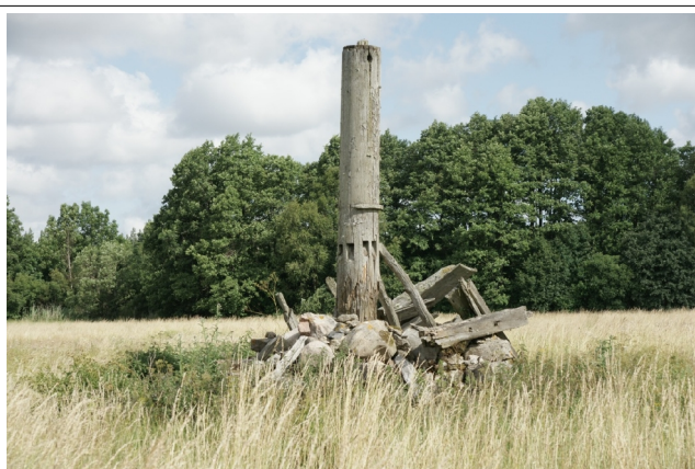
11 Kotsma2 N:58-19-27 E:22-01-01