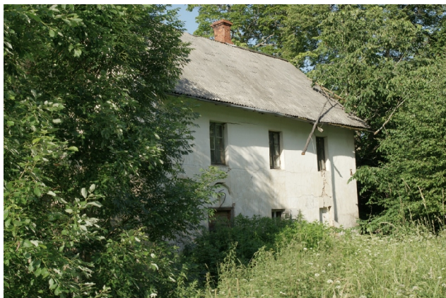
37 Vana-Saaluse N:57-43-35 E:27-13-18