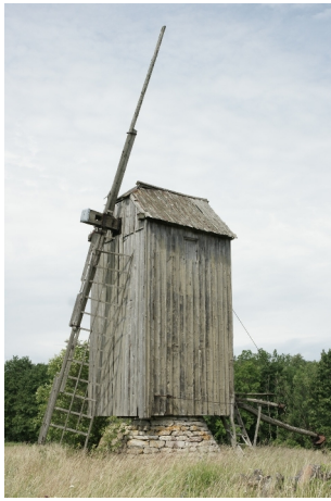
01 Simisti N:58-33-38 E:23-18-40