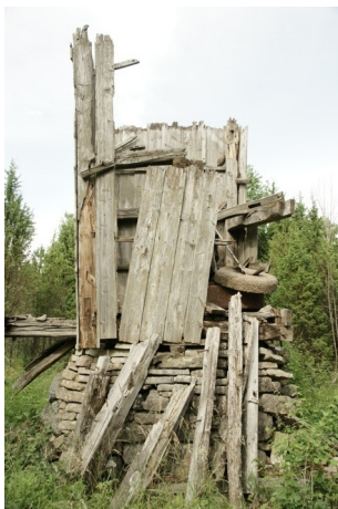
05 Liigalaskma3 N:58-34-41 E:23-00-07