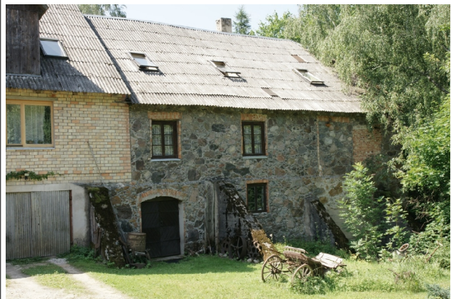
38 Lautere N:56-55-27 E:26-00-57