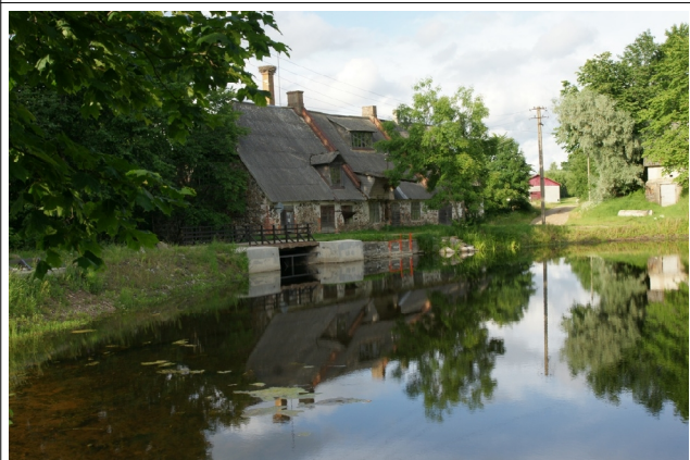
30 Lahmuse N:58-33-37 E:25-26-58