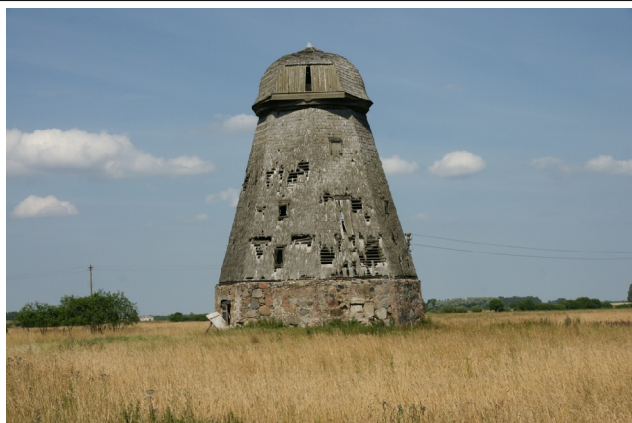
69 Ķaķiņķe N:56-11-23 E:21-10-31