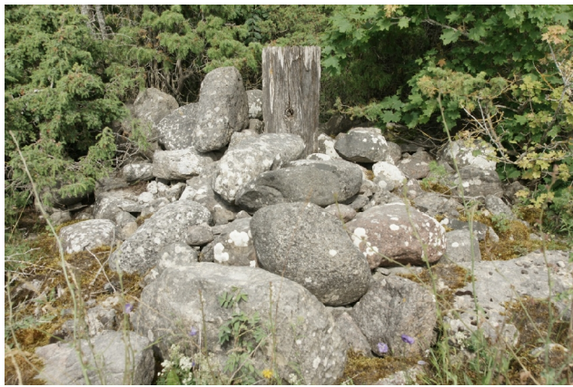
17 Kõruse3 N:58-26-43 E:21-57-15