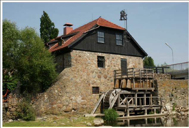
66 Mosėdis N:56-09-55 E:21-34-28