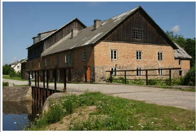
34 Hellenurme N:58-08-12 E:26-23-10