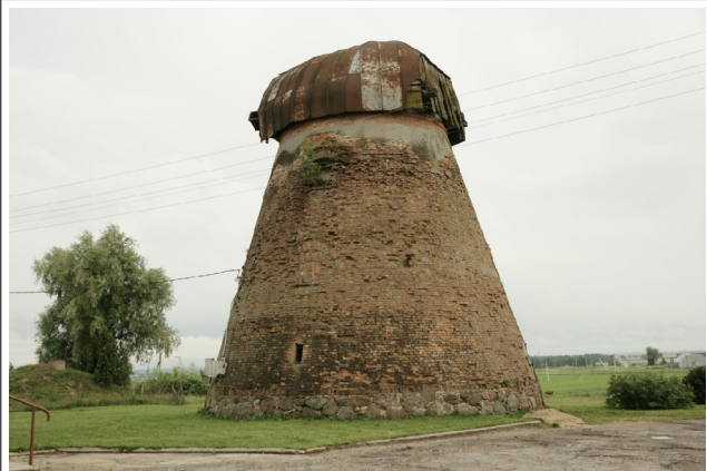
52 Kalpokai (Linkuva) N:56-04-43 E:23-57-55