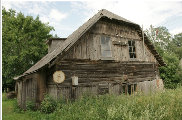
36 Illi N:57-42-58 E:27-19-16