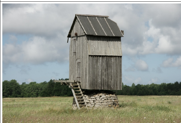
12 Kuusnõmme N:58-19-20 E:22-00-05