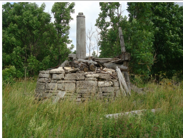
10 Kotsma1 N:58-19-22 E:22-01-01