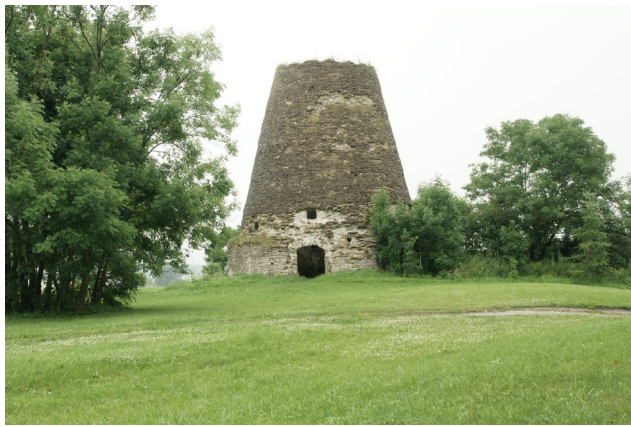
25 Lihula (Kõmsi) N:58-41-37 E:23-50-30