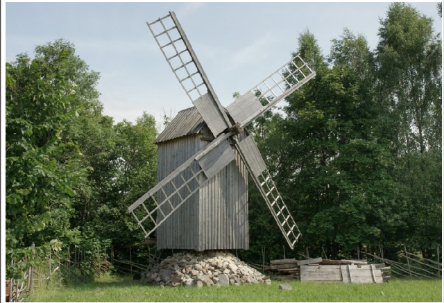
02 Vanamõisa N:58-34-34 E:23-13-47